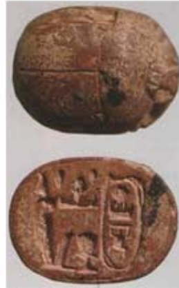
Скарабеј са картушом Тутмеса III