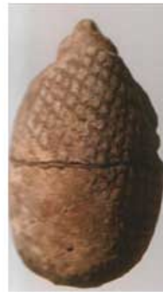
Скарабонд у виду јежа