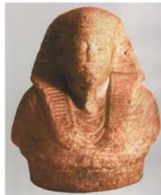
Поклопац канопе од мермера из Новог Царства/Птолемејског периода