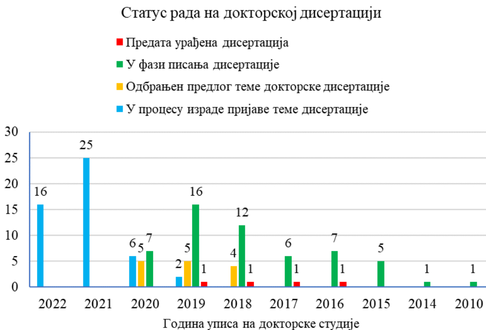
График 1. Број кандидата у свакој од фаза рада на докторској дисертацији, према години уписа на докторске студије

Када је реч о научној продукцији у претходном акредитационом периоду, односно од 2019. године до марта 2023. године, научни подмладак на Факултету је објавио у просеку пет научних резултата који се вреднују према важећем правилнику Министарства. Број објављених радова се креће између ни једног (што је случај углавном за кандидате који су недавно започели докторске студије) и 25 (Min = 0; Max = 25; M = 5,06; SD = 5,73). Преглед броја објављених радова у претходном акредитационом периоду у односу на годину уписа научног подмлатка на докторске студије дат је у Графику 2, а списак објављених радова дат је у табели у Прилогу 2.